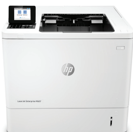
HP LaserJet Enterprise M607dn