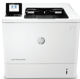
HP LaserJet Enterprise M608dn